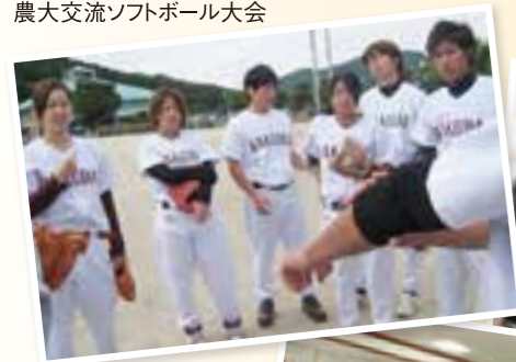
農大交流ソフトボール大会