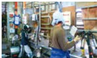
第2牧場飼養形態：タンデムパーラー・フリーストール・TMR給与