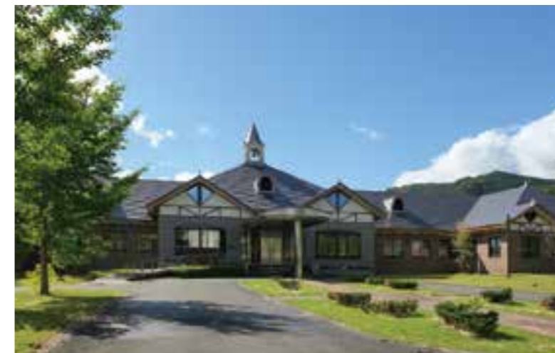
中国四国酪農大学校/本館