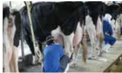
第1牧場飼養形態：レール式パイプライン ニューヨークタイストール・分離給与