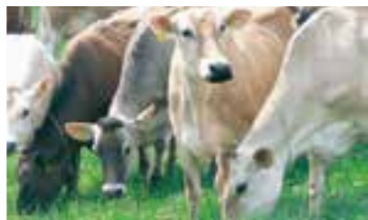
第2牧場飼養品種：ジャージー種