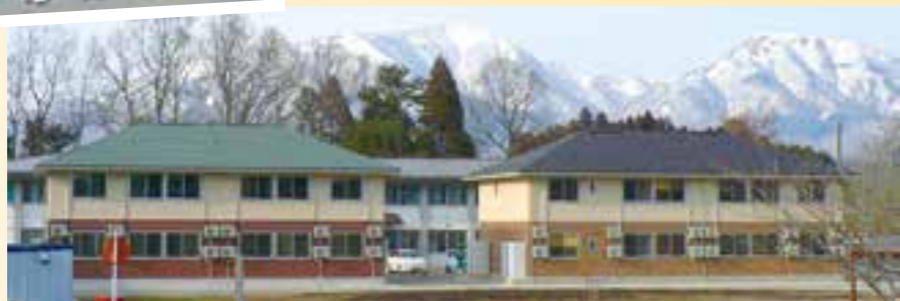
学生寮と蒜山三座