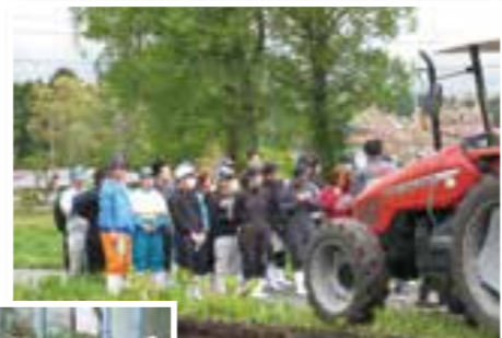
牧草飼料作物演習