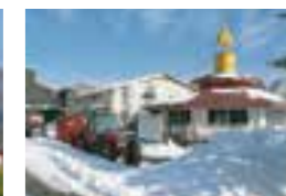
搾乳牛舎及び搾乳施設(冬)