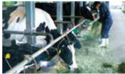
第1牧場飼養品種：ホルスタイン種・和牛